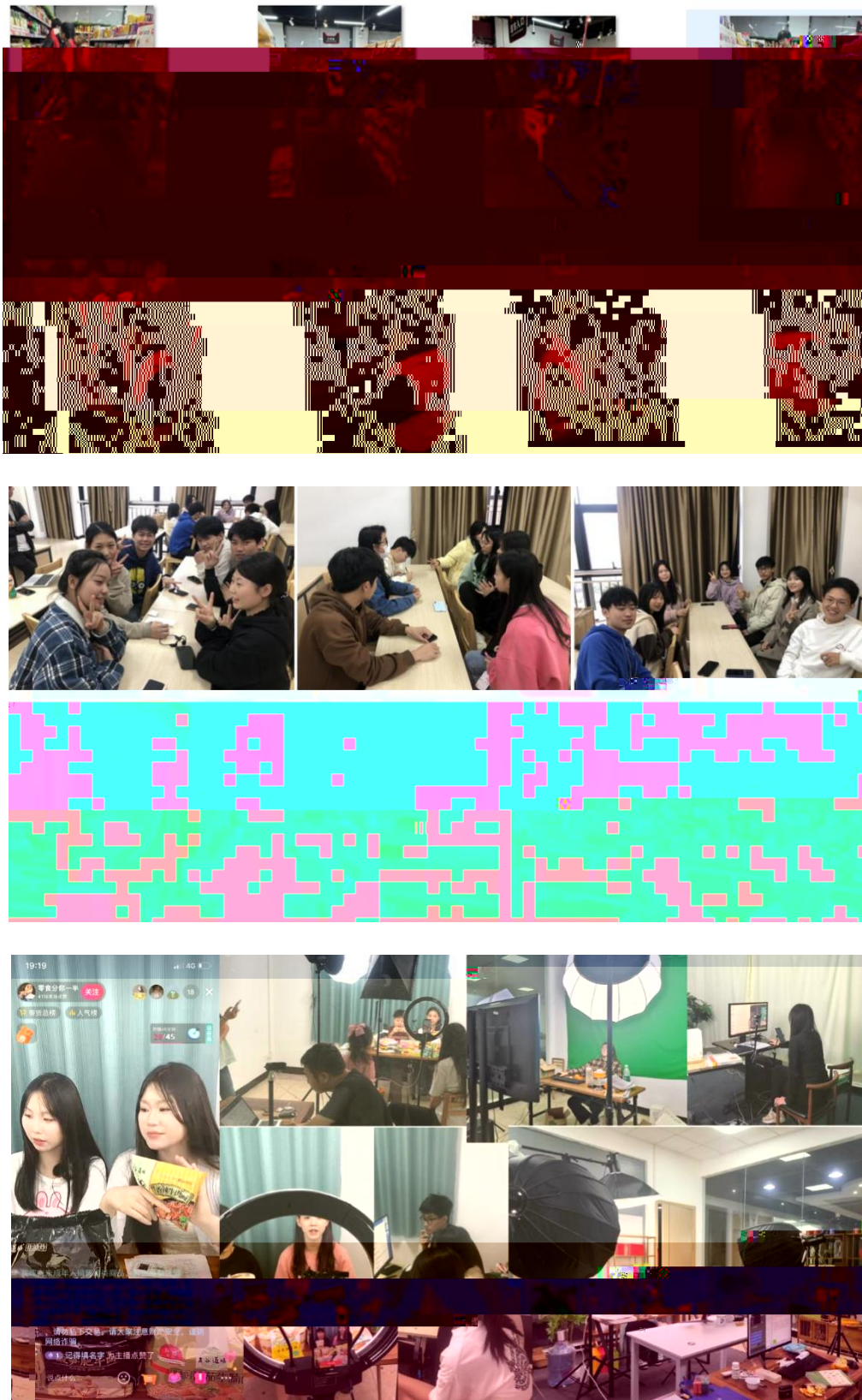
图 组织学生开展实习实训