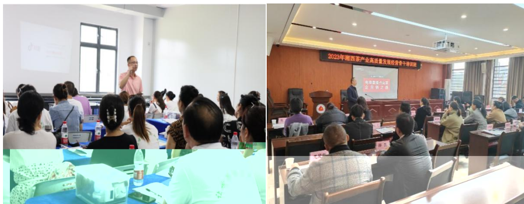
图 企业协助学校为湘西茶企开展电商直播培训

更 对 电 的 。 过 的 ， 茶 得 更 地 电 播的操 、 策 等方 的 ， 电 的 奠定 础。