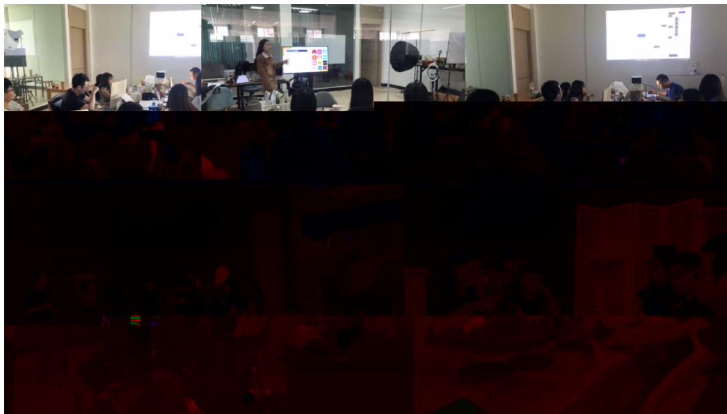
图 特邀企业专家来基地为学生进行专业培训

地 2023 地 ( 2), 供 宝贵的 。 过 的分 , 度 、 场变 , 对电 播 的 。 不 的 储备, 高 操 , 的 发 奠定 础。 措 合 的 度, 地 合 的 。